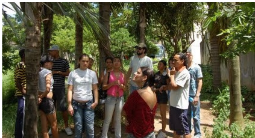
Visita monitorada a Pça M. Quitéria, nascida a partir de mutirão popular

Numa conversa sobre a ocupação de áreas de risco, discutiu-se sobre a deficiência histórica do país em implantar políticas públicas voltadas a moradia popular.