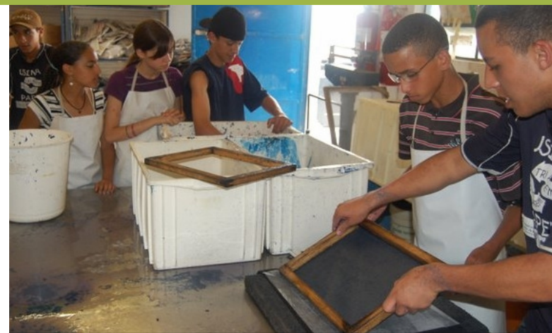
Confecção de papel reciclado na Usina de Papel

Conscientização acerca dos problemas, formulação das perguntas, construção de estratégias e avaliação das ações desenvolvidas são as etapas vivenciadas pelos jovens do Projeto.