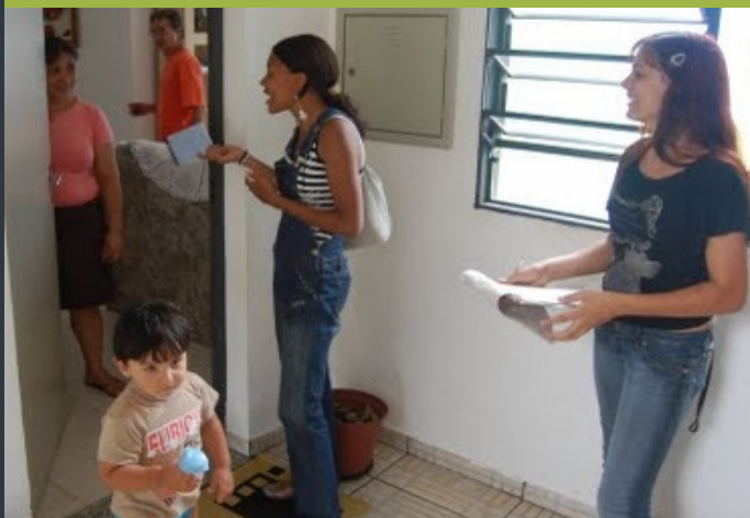
Participantes do projeto durante pesquisa participativa

Além disso, a partir de fevereiro, os parceiros podem receber os jovens capacitados pelo projeto como estagiários.